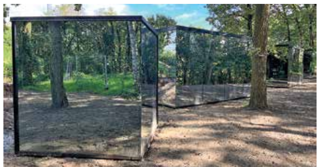
Die verspiegelten Tiny Houses verschmelzen fast mit ihrer Umgebung. Von drinnen bieten sie eine unversperrte Sicht nach draußen, schützen aber gleichzeitig vor Blicken von außen.