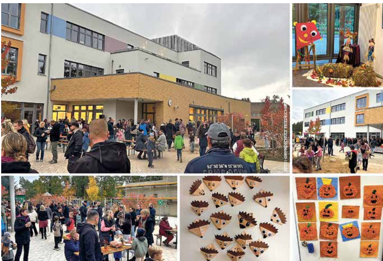
Zum zweiten Mal lud die Grundschule Friedrichsthal zum großen Herbstfest ein, das wieder ein buntes Programm bot.

Die Grundschule Friedrichsthal bedankt sich bei allen Beteiligten, insbesondere den Lehrkräften der Grundschule, dem Hort und allen anderen, die zum Gelingen dieses schönen Tages beigetragen haben. ■