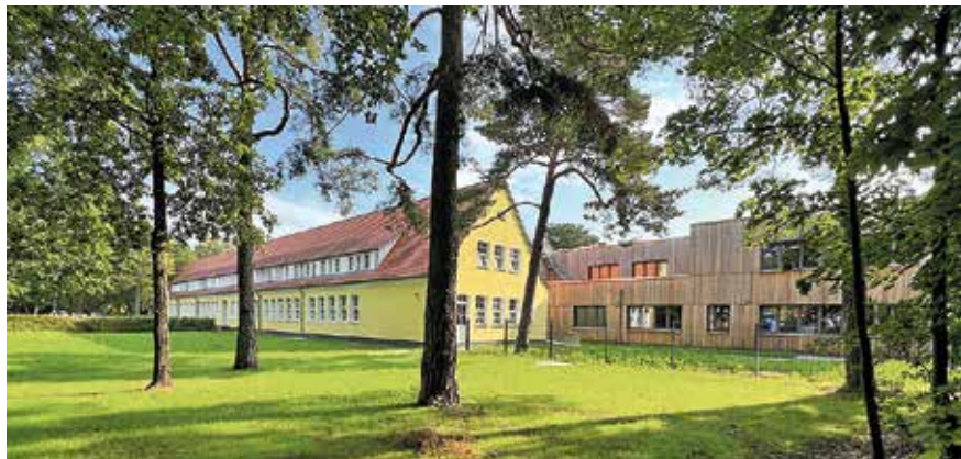
Alt und neu Seite an Seite. Das sanierte Hauptgebäude und der moderne Anbau prägen jetzt gemeinsam das Gesicht der Friedrich-Wolf-Grundschule.

Für die knapp 340 Schülerinnen und Schüler gibt es im Erdgeschoss acht Klassenräume, das Obergeschoss wird fast vollständig vom Hort genutzt. Auf beiden Etagen wurden neue Elektro-, Trinkwasser- und Heizungsleitungen verlegt. Die Wände haben einen neuen Putz und Anstrich erhalten, der Fußboden wurde inklusive Bodenplatte, Estrich und Bodenbelag komplett erneuert. Das Untergeschoss wurde mit einer Fußbodenheizung ausgestattet. Der bisherige Gasanschluss für die Wärmeversorgung ist zudem durch Luft-Wasser-Wärmepumpen ersetzt worden. Der Aufzug wurde am Verbindungspunkt zum Altbau angebaut, so dass beide Gebäude auch im oberen Geschoss barrierefrei erreichbar sind. Im Flur sind verschiedene Sitzmöglichkeiten entstanden, um vielfältige Möglichkeiten zum Lernen zu bieten. Außerdem ermöglichen bodentiefe Fenster jetzt den Blick in den Hof und schaffen eine helle, freundliche Atmosphäre. Die Klassenräume sind mit