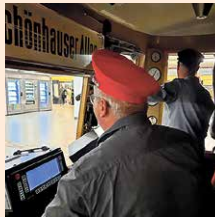
Ganz vorne mit dabei: Bürgermeister Alexander Laesicke.