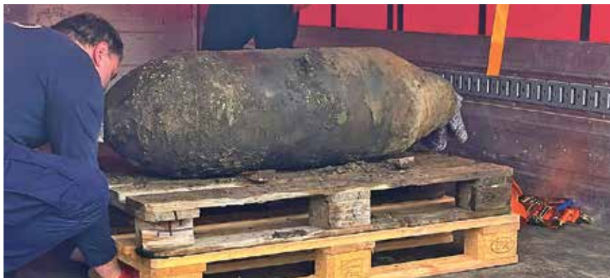
236 Bomben wurden im Oranienburger Stadtgebiet bereits zu Tage gefördert und unschädlich gemacht. Rund 200 weitere liegen noch im Boden.

Auch auf der „Biberinsel“ wurde im Sommer ein metallischer Gegenstand festgestellt. Er befand sich auf einer kleinen vegetationslosen Fläche zwischen Havel und ehemaliger Biberfarm, etwa fünf Meter unter der Erde, so dass die Freilegung einige Vorarbeit erforderte. Zunächst musste das