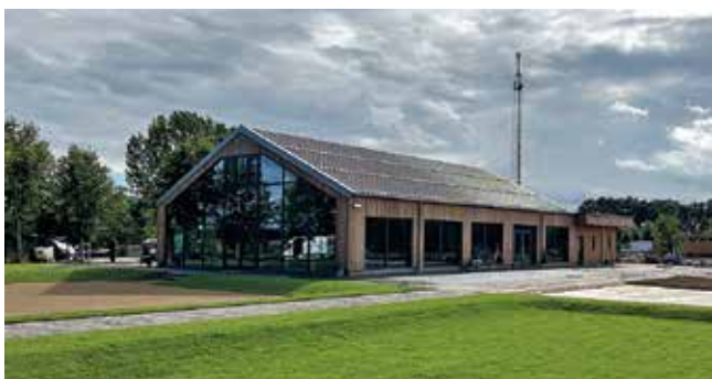
Das Restaurant wird künftig noch um einen Biergarten ergänzt. Auch ein Nutzgarten zum Anbau von Obst und Gemüse ist geplant.

Eröffnet wurde die Caravanserei am 1. Oktober mit einem Wochenende voller Musik und Programm. Einen Wermutstropfen gibt es allerdings: Im Sommer verkündete die Niederbarnimer Eisenbahn, dass die von ihr betriebene RB 27, besser bekannt als Heidekrautbahn, ab Dezember 2025 nicht mehr nach Schmachtenhagen fahren wird. Die Gäste müssen also erstmal mit dem Auto, Fahrrad oder Bus anreisen. Bequemer als die Anreise in die namensgebenden historischen Karavansereien, die Handelsreisenden im Orient einst eine Herberge boten, ist das allemal. Zu ihnen ging es meist nur mit dem Kamel. ■