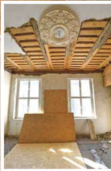
Auch die Stuckdecke im Kaminzimmer hat zu ihrer alten Pracht zurückgefunden.