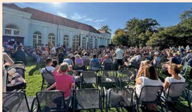
Zaubershow, Konzerte und Mitmachaktionen – der Zaubertag bot ein buntes Programm.