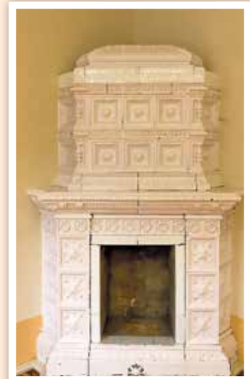
Der verzierte Kachelofen stammt aus der Zeit um 1900. Nach seiner Aufbereitung ist er wieder ein echtes Schmuckstück.