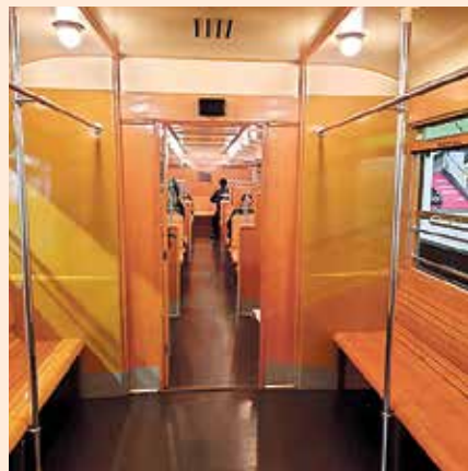
Nostalgischer Charme in historischen Sonderzügen.