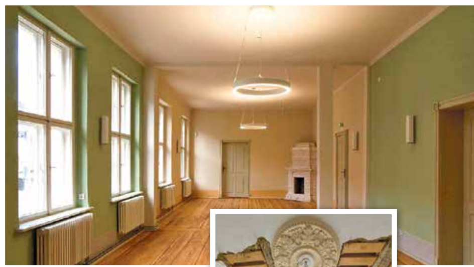
Der große Saal im Erdgeschoss bekam einen Anstrich in zartem Lindgrün. Die Dielen aus dem 19. Jahrhundert blieben erhalten und wurden lediglich aufgearbeitet. Lücken im Bodenbelag wurden durch hinzugekaufte Altdielen geschlossen.