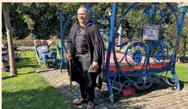
Beim Zaubertag übernahmen Hexen und Magier für einen Nachmittag den Schlosspark.

ma S-Bahn. Mittags folgte bereits das nächste große Event: Der Schlosspark verwandelte sich für mehrere Stunden in eine bunte Zauberwelt, die Jung und Alt zu spannenden Mitmachaktionen, Shows und Entdeckungstouren einlud. Und das bei freiem Eintritt! Finanziert wurde der Zaubertag nämlich mit Mitteln aus dem Bürgerhaushalt. Ein Tag voller magischer Momente und unvergesslicher Erinnerungen für Oranienburg. ■