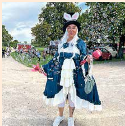
Jede Menge zauberhafte Outfits gab es ebenfalls zu bestaunen.