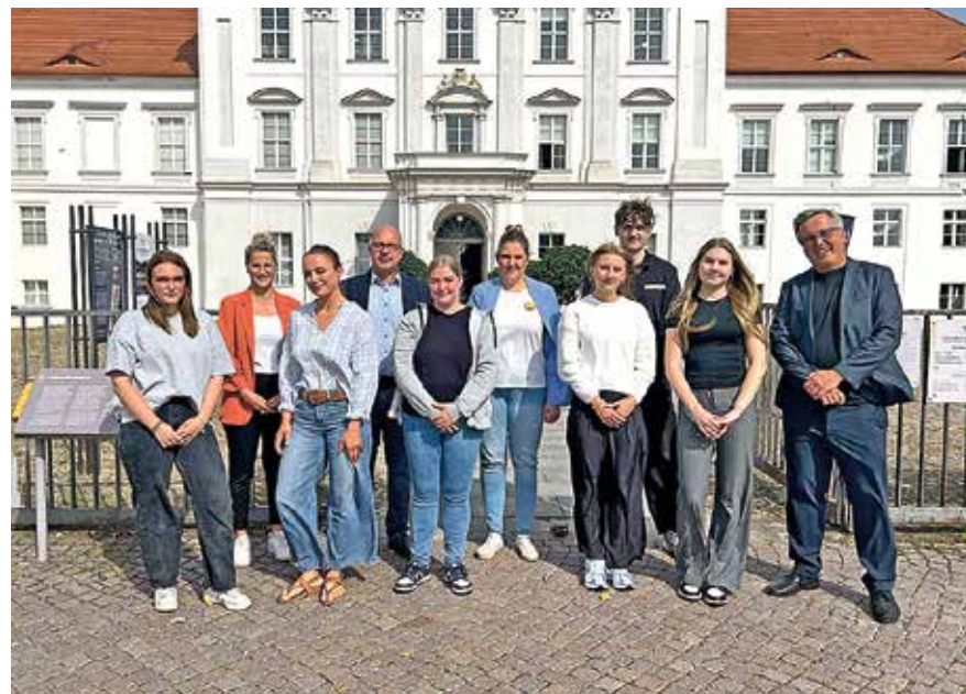
Auftakt einer aufregenden ersten Ausbildungswoche: Nach einem gebührenden Empfang vor dem Schloss ging es für die neuen Verwaltungs-Azubis auf Erkundungstour durch die verschiedenen Fachbereiche.

Insgesamt 23 Menschen machen zurzeit eine Ausbildung bei der Stadt Oranienburg, darunter sieben Verwaltungsfachangestellte, ein Fachin-