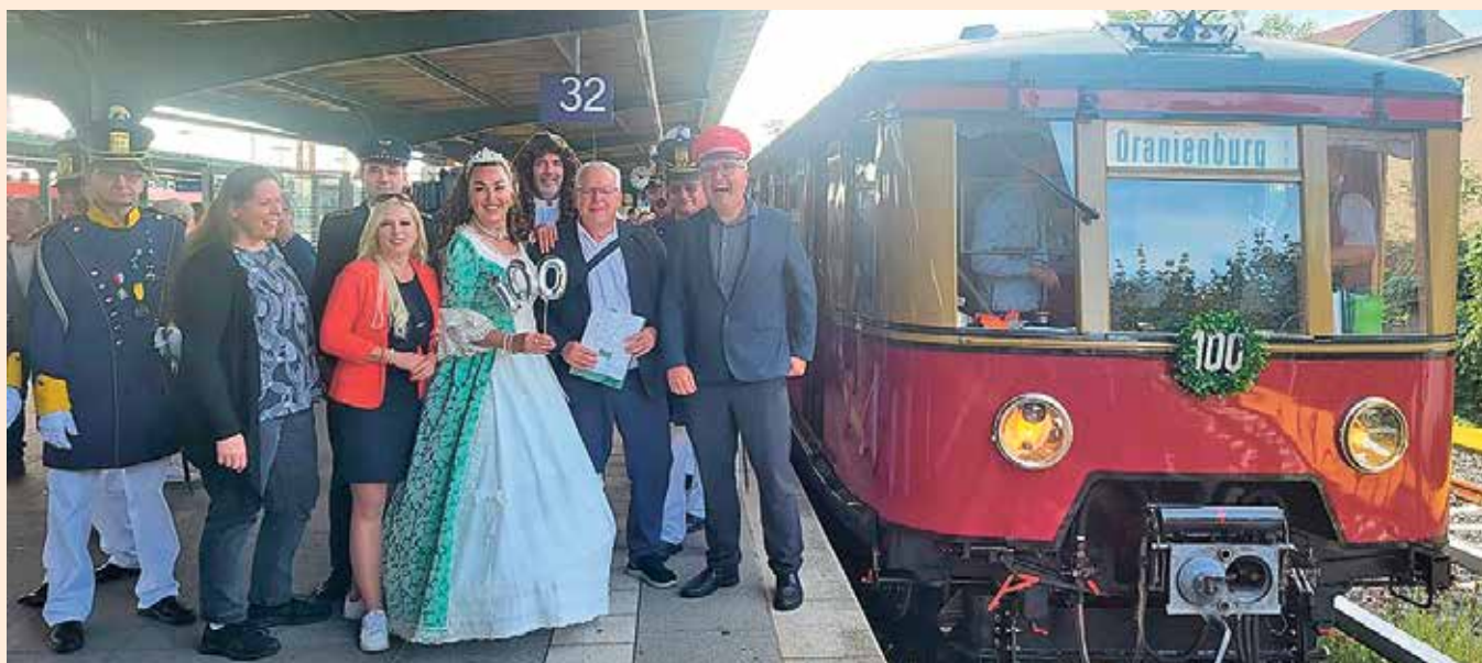
Großer Empfang des ersten Sonderzugs am Bahnhof. Natürlich dabei: das Kurfürstenpaar.