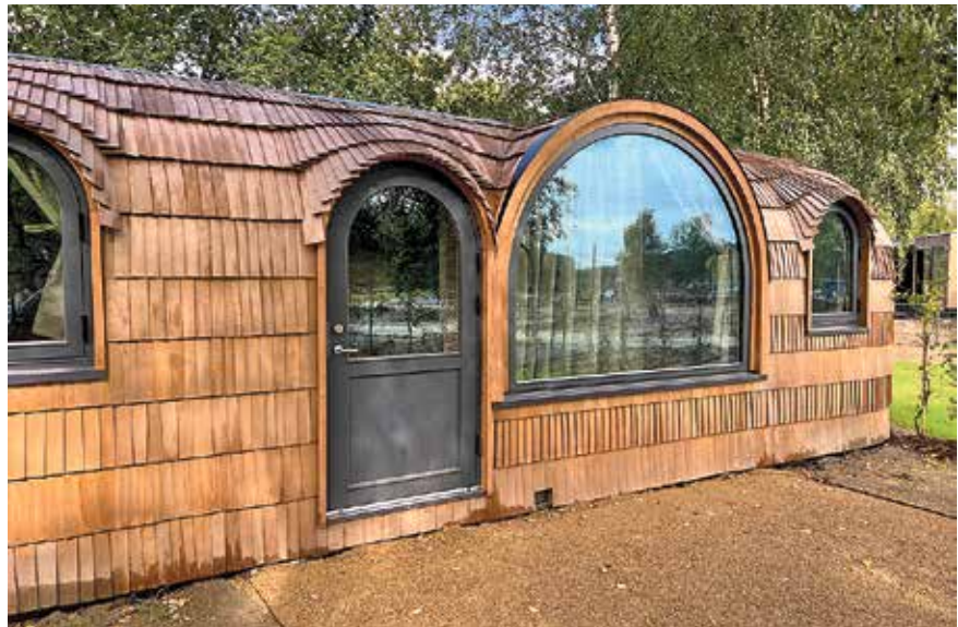
Urig, nachhaltig und gemütlich: Die Tiny Houses der Caravanserei bieten alles, was es für einen Kurzurlaub braucht. Die unterschiedlichen Modelle stammen aus Wales, Estland und Deutschland.

Das resorteigene Restaurant setzt auf regionale, frische Küche und steht auch externen Gästen offen. Was hier auf den Teller kommt, stammt von Produzenten aus der Region – oder künftig aus dem eigenen Küchengarten, der zunächst allerdings noch wachsen und gedeihen muss. Für Fei-