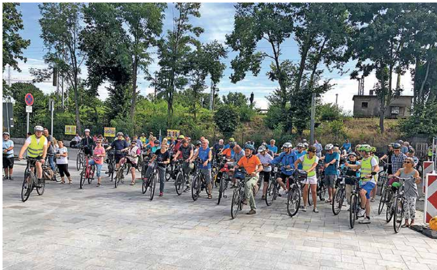
Die ADFC-Ortsgruppe bot während des Stadtradelns wieder mehrere geführte Radtouren an, bei denen gemeinsam Kilometer gesammelt werden konnten

Für Hennigsdorf traten 584 Teilnehmer in 33 Teams in die Pedale. Mit 114.903 eingefahrenen Kilometern ergatterten sich die Hennigsdorfer den zweiten Platz (2023: Platz 2 mit 121.000 Radkilometern und 548 Teil-