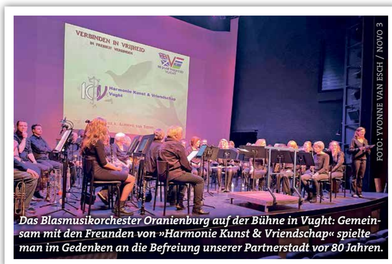
Das Blasmusikorchester Oranienburg auf der Bühne in Vught: Gemeinsam mit den Freunden von »Harmonie Kunst & Vriendschap« spielte man im Gedenken an die Befreiung unserer Partnerstadt vor 80 Jahren.