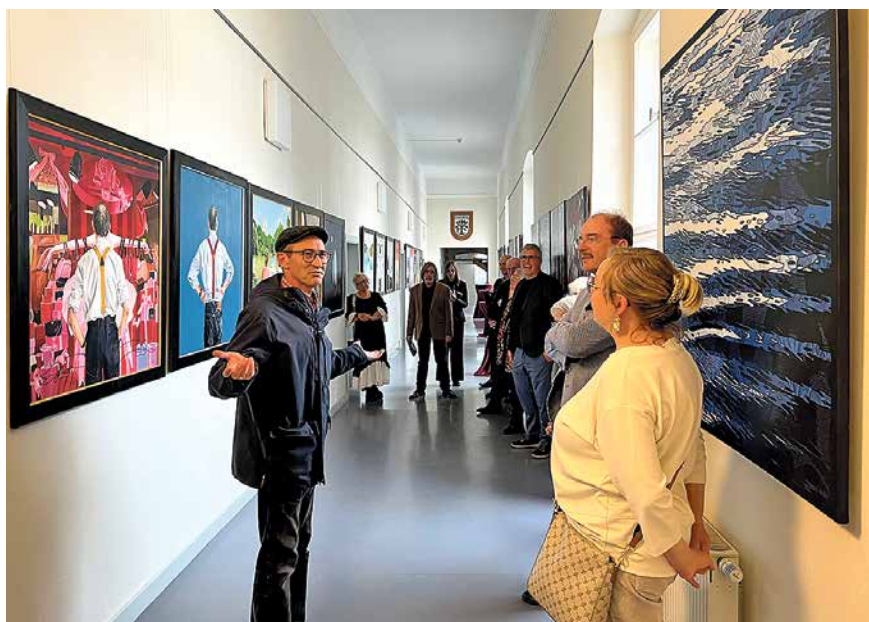
Hammer Kunst im Schloss. Am 2. Oktober wurde die Ausstellung „Künstlertausch Hamm-Oranienburg“ in der Galerie der Stadtverwaltung feierlich eröffnet.

Osman Bols Gemälde nehmen den Betrachter mit auf eine Reise zu verschiedenen Stationen seines Lebens, zu seinen Reisen nach New York, zu persönlichen Verlusten, politischen Überzeugungen bis hin zu seinem Lieblingsfilm. Konsequenterweise zeigt sich Bol auf den Bildern auch selbst – mit dem Rücken dem Betrachter zugewandt, wird der Künstler selbst zum Beobachter seiner auf die Leinwand gebrachten Lebensszenen. In Hamm gehören Osman Bols Bilder sogar zum Stadtbild: Der Künstler hat dort meh-