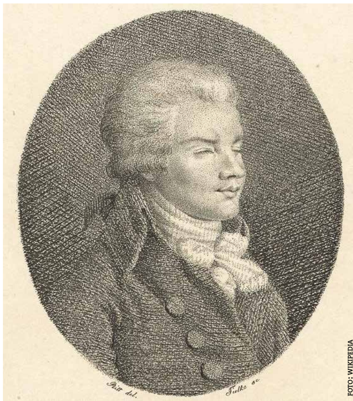
Ein Star seiner Zeit: Friedrich Ludwig Dulon gehörte zu den berühmtesten Flötenvirtuosen des ausgehenden 18. Jahrhunderts. Geboren wurde er in Oranienburg.

„blinde Flötenvirtuose“ zog er auf seinen Konzertreisen auch Gäste an, die weniger auf ein musikalisches Vergnügen als auf eine kuriose Sensation aus waren. Auch bei zeitgenössischen Künstlern fand sein Schicksal Anklang. Den Dichter Christian Friedrich Daniel Schubart inspirierte es zu dem sentimentalen Gedicht „Dem blinden Flötenspieler auf die Reise“, in dem es heißt: