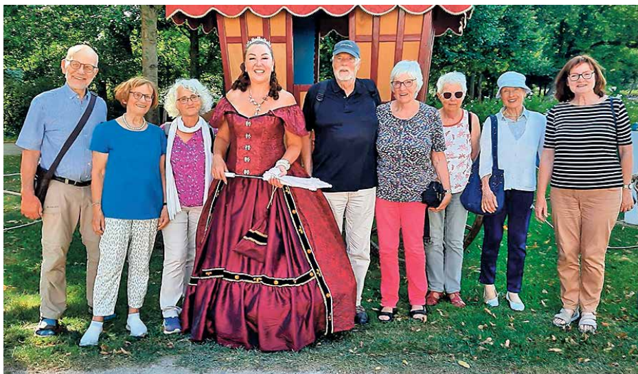
Ein Arbeitskreis aus Hamm beschäftigt sich Jahren mit den Spuren des Judentums. Im September waren die Mitglieder zu Besuch in Oranienburg, wo sie unter anderem mit der Kurfürstin den Schlosspark besuchten.

„Woche der Begegnungen mit dem Judentum Hamm“ nennt sich der Arbeitskreis aus Hamm, den im September eine Studienreise nach Oranienburg führte. Mit Mitarbeitern aus der Stadtverwaltung begab sich die Gruppe auf eine mehrtägige Tour durch das historische und aktuelle Oranienburg, die auch das jüdische Leben in der Stadt in den Blick nahm. Neben einem Besuch bei der Jüdischen Gemeinde Oberhavel und in der Gedenkstätte Sachsenhausen ging es auch ins Schlossmuseum, mit Louise-Henriette durch den Schlosspark und zum Abschluss mit Bürgermeister Alexander Laesicke zum Essen ins „L'Oasi“. Der Bürgermeister war im letzten Jahr selbst zu Gast in Hamm, um dort an der „Woche der Begegnungen mit dem Judentum Hamm“ teilzunehmen und aus seinem Buch „Mein Weg nach Jerusalem“ vorzulesen. In diesem Jahr also der Gegenbesuch,