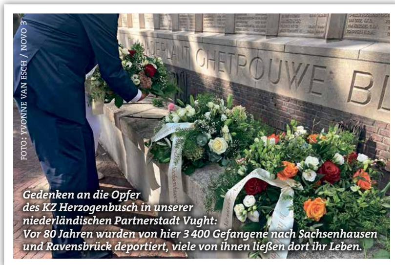
Gedenken an die Opfer des KZ Herzogenbusch in unserer niederländischen Partnerstadt Vught: Vor 80 Jahren wurden von hier 3 400 Gefangene nach Sachsenhausen und Ravensbrück deportiert, viele von ihnen ließen dort ihr Leben.

MIT UNSEREN PARTNERSTÄDTEN verbinden uns weiterhin zahlreiche Begegnungen