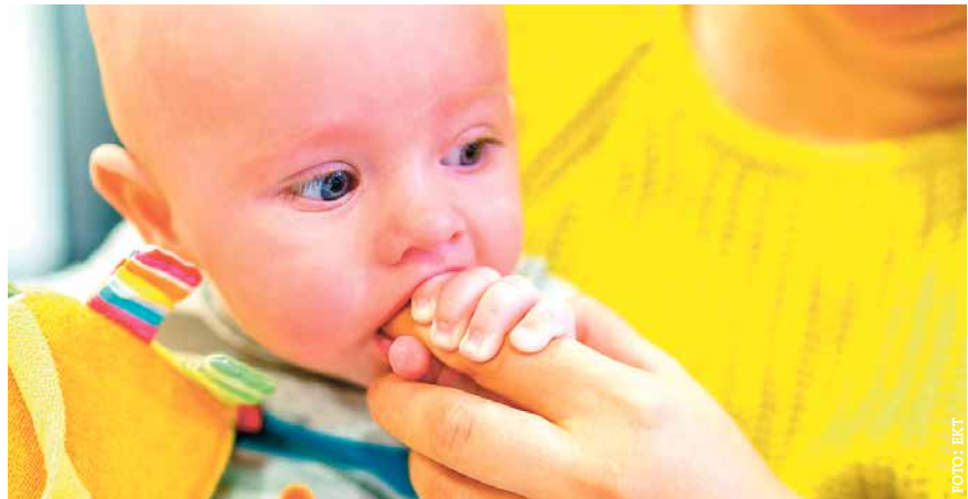
Ein Unfall ist schnell passiert. Die Erste-Hilfe-Kurse im EKT zeigen, wie vor allem Kindern in einem Notfall richtig geholfen wird.

Die Rettungsanwältin war entsetzt, wie viele Menschen hilflos zusehen hatten, und beschloss, eine Organisation zu gründen, die Erste-Hilfe-Kenntnisse und Sicherheit bei der Anwendung vermittelt. Seitdem ist sie regelmäßig in Kitas, Schulen oder anderen öffentlichen Einrichtungen unterwegs und zeigt, wie im Ernstfall Leben gerettet werden können. Im Oraniensburger Eltern-Kind-Treff ist