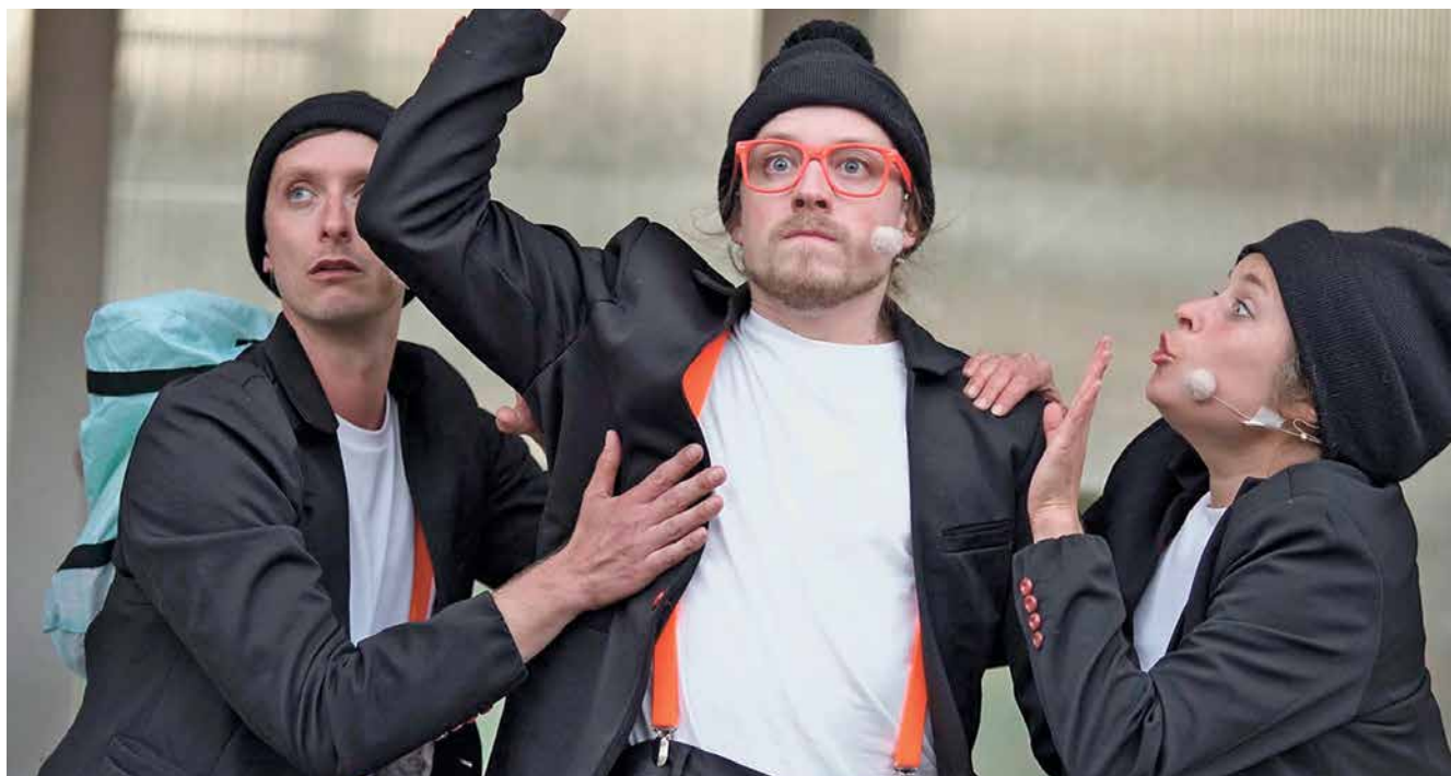
Drei Pinguine in Not: Ob sie sich vor der Sintflut retten können, erfahren die Gäste von „An der Arche um acht“.

Samstag, 14. Dezember, 20.00 Uhr, Kultursaal Offene Bühne