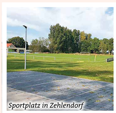
Sportplatz in Zehlendorf

Eine andere beliebte Sportfläche befindet sich am östlichen Rand des Stadtgebiets. Im Jahr 2020 konnte sich der Sportverein Post SV Zehlendorf bereits über ein neues Sportfunktionsgebäude für seinen Sportplatz freuen. Die Kosten in Höhe von rund 1,2 Millionen Euro wurden zu 75 Prozent durch das EU-Förderprogramm LEADER finanziert. Die restlichen Kosten übernahm die Stadt. Im letzten Jahr bekam der Zehlendorfer Sportplatz dann noch ein neues Kleinspielfeld, eine Flutlichtanlage und eine Erneuerung des Beachvolleyballplatzes. Auch hierfür gab es eine LEADER-Förderung, mit der die Kosten in Höhe von rund einer Million Euro zu 75 Prozent gedeckt werden konnten. Den restlichen Betrag investierte die Stadt aus Eigenmitteln.