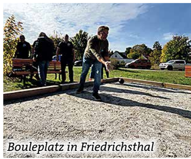
Bouleplatz in Friedrichsthal

Auch in Schmachtenhagen wird dem Sport mehr Raum gegeben. Die Sporthalle auf dem Schulcampus ist inzwischen zu klein geworden, um den Anforderungen von Schul- und Vereinssport gerecht zu werden. Die Stadtverwaltung hat bereits Planungen für einen Neubau aufgenommen.