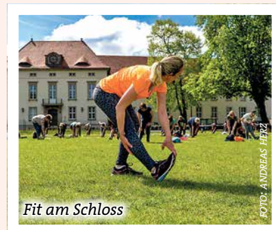
Fit am Schloss